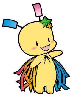
狭山市セタの妖精 おいひい