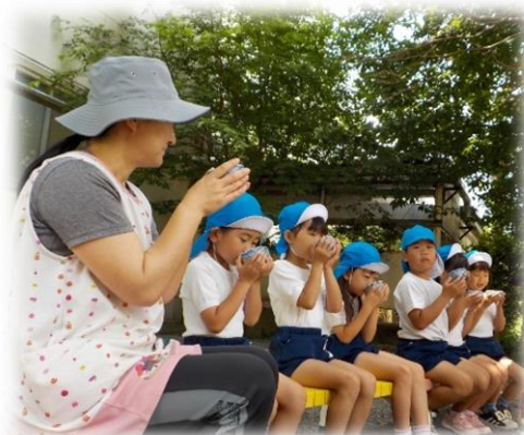
年長組・新茶のお茶体験 狭山茶の味を楽しみました。「狭山茶っておいしいね」