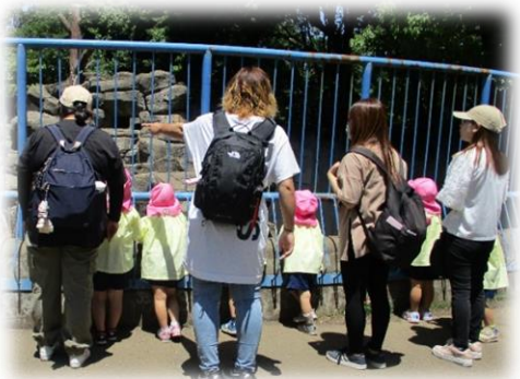
年少組・春の遠足 青空の下、智光山公園の動物園に親子遠足。サル山では、えさをあげる体験もしました。