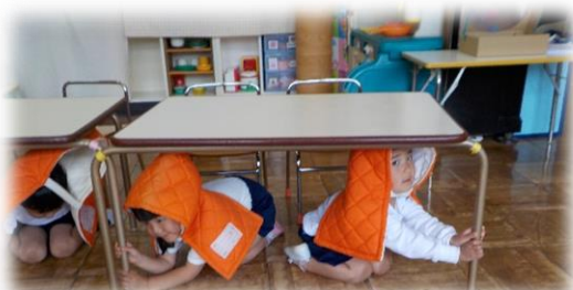
地震を想定した避難訓練をしました。年少組は、サイレンの音にドキドキしながらも、しっかり避難ができました。引き取り訓練でおうちの方にもご協力いただきました。

年少組ではお弁当も始まり食事の時間も楽しそうです。年長児が当番の仕事を毎日、2人ずつ年少組の部屋に入り、やって見せてくれています。「年長さんって、すごいな」と憧れの気持ちをもって年少児はお当番の姿を見えています。肩には素敵なお当番の印のお当番バッジがついています。「難しそうだけど年長さんみたいにやってみたい」と、思う気持ちが大切です。身近な子供のモデルになってくれる年長組の存在は、とても刺激になるようです。年長児にとっても、「人のために何かができる」「頼りにされる」ことはとても良い経験です。幼稚園ではこの縦の繋がりを大事にしています。6月も遊びに興味を広げ、友達との関わりをもてるように、また天気の良い日には、砂や水に触れて開放感を味わえるように援助していきたいと思います。