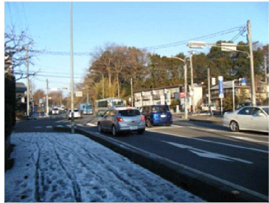
B ・交通量が非常に多い交差点。横断歩道を渡っているときに、背後からくる自動車に注意が必要。