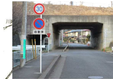
I 住宅街にあるが、人通りが少ない。不審者に注意が必要。