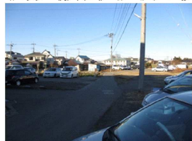
G 人通りが少ない通学路になっている。駐車場になっているので、自動車の出入りに注意が必要。