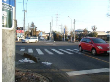
C 細い歩道になっている。自転車なども通るため、危険がともなう。側溝ブロックのすき間に足が引っかかり、危険。