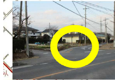
J 細い道になっている。スピードを出して走る自動車がある。細い道に入っていくと、人通りが減る。