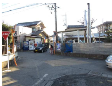
H 見通しの悪い十字路になっている。