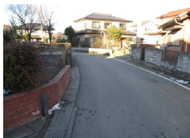
F カーブになっているが、ミラーがなく見通しが悪い。