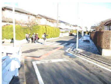
E 変則的な十字路になっている。歩行者は、自動車が見えにくいので、安全確認をしっかり行うこと。