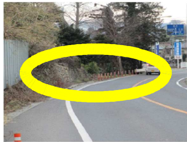
A 歩道が確保されておらず、歩行が危険である。