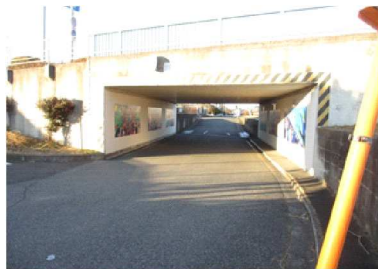
D 住宅街にあるが、人通りが少ない。不審者に注意が必要。