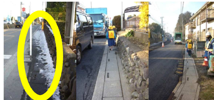
L 車道と歩道との間がほとんどない。歩道は狭く、自動車に接触する危険性がある。