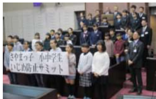
参加者全員での記念撮影