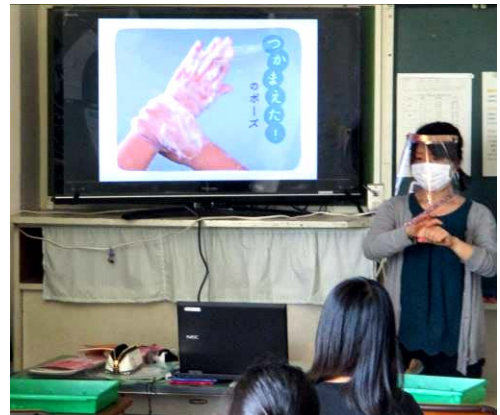
手洗いの指導（準備登校にて）