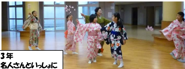
3年 名人さんといっしょに