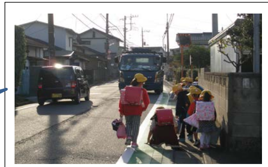
鶴の木方面の 下校時の様子