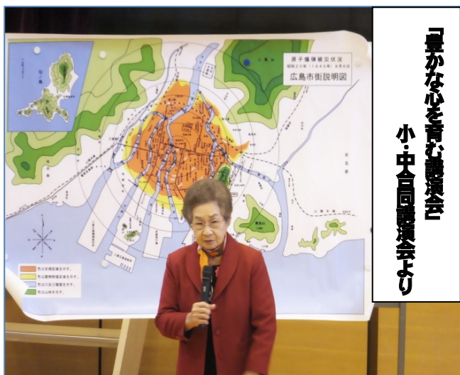
「豊かな心を育む講演会」 小・中合同講演会より