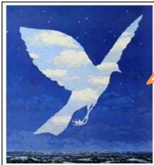
ベルギーの画家 ルネ・マグリッド の作品「大家族」

①は、人権教育の大原則である「自分がされていやなことは人に絶対にしない」ことの裏返し表現であり、一歩進んだ理想の姿です。②は、多くの児童がまだ十分にできていないと感じている課題です。3学期は基礎学力の着実な定着を図るとともに、この2点を重点に、児童の心の成長を促していきたいと考えます。本年も引き続き、保護者、地域の皆様の変わらぬご支援とご協力をよろしくお願い申し上げます。