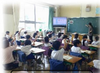
学習補助:小1対応講師