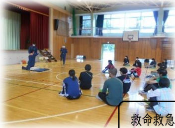
救命救急法(AED)研修:教員