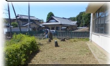
きれいに草刈り:校務員