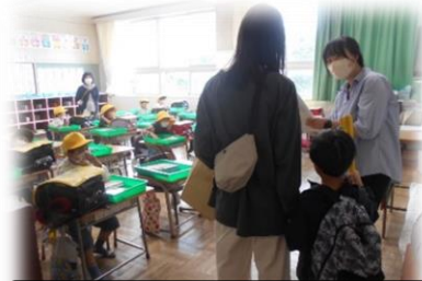
引き取り訓練補助等:わくわく支援員