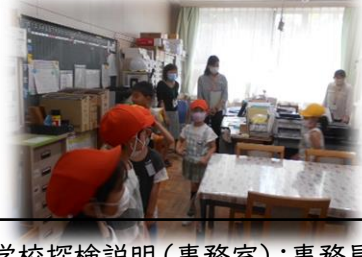
学校探検説明(事務室):事務員