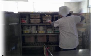
給食を片付け、トラックへ:配膳員