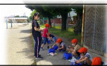
種まき補助:学習支援ボランティア(学生)