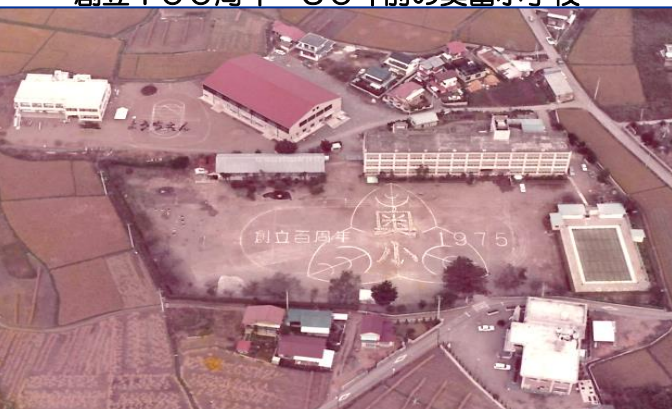
創立100周年 50年前の奥富小学校