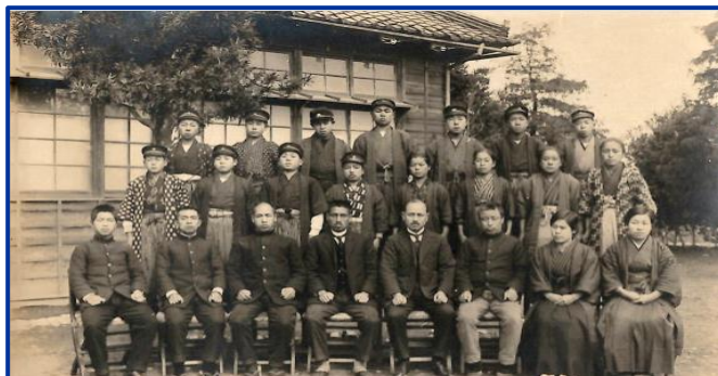
大正10年奥富尋常高等小学校卒業生