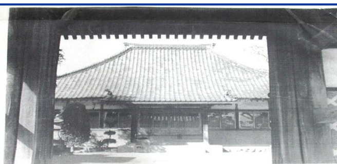
瑞光寺 明治7年2月「上奥富学校」開校