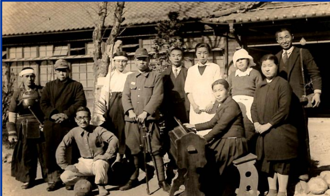
昭和16年ごろの職員