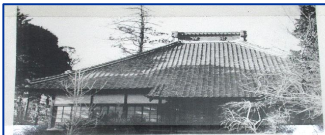
広福寺 明治22年5月28日 「奥富村公立尋常小学校 奥富学校」開設