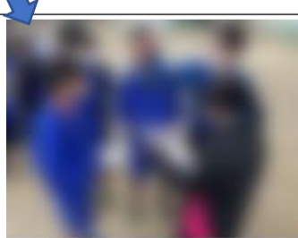
↑旧会長からゲストの方々へ感謝の言葉

会の終了後にゲストの方々とは新旧本部役員で記念写真を撮りました。今後もよろしくお願いします。↓