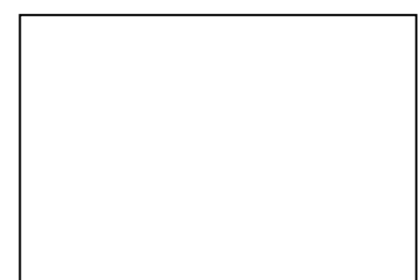
バスケットボール部女子