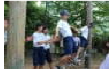
ロープの上でのバランスは・・・