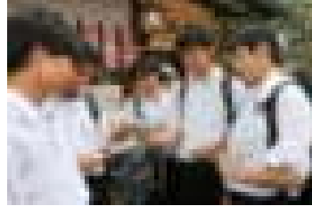
地主神社恋占いおみくじ 結果は？

5月31～6月2日、京都・奈良方面に3年生が修学旅行に行ってきました。今年度は、宿泊場所が宿坊ということで、早朝6時から朝のお勤め（朝勤行・護摩供法要）に二日間とも参加させていただきました。厳粛な雰囲気の中、非日常の世界を体験することができました。生徒一人一人が責任ある行動をとることができ、「少し大人に近づいた修学旅行」でした。