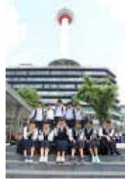
京都タワーを背景にハイチーズ！