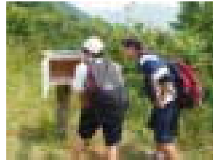
ついにスタンプ発見！

5月31日・6月1日に、2年生の宿泊学習に行ってきました。30日は、「さがみ湖プレジャーフォレスト」でオリエンテーリング、仲間づくり集会、「高尾の森わくわくビレッジ」に移動して飯盒炊さん、キャンプファイヤー、1日は、プロジェクトアドベンチャー等を行いました。最後まで元気に活動し、「丸ごと仲良く協力する」という目的を達成することができました。