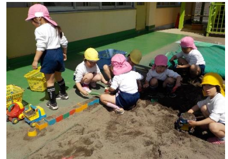
砂場では、一緒に遊びながら、年長の真似をして、片付け方も覚えます。