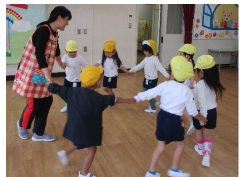
年少児は、みんなで手をつないで、簡単なゲームでも大喜び！「幼稚園って楽しい」