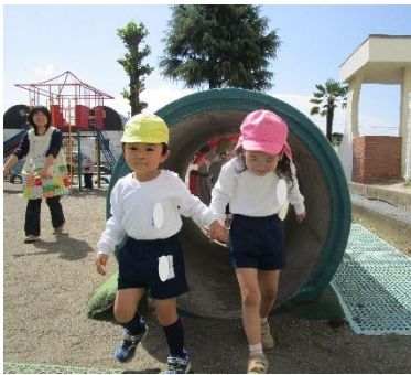
園庭巡りでは、年少児の手をつなぎ園庭を巡りながら、遊具の乗り方の約束を年長児が教えました。