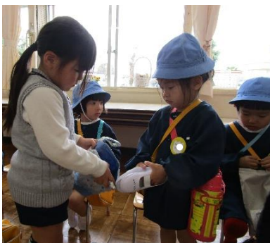
上履きを持ち帰る時のしまい方や水筒の紐の始末の仕方など年長児に教えてもらう場面がありました。