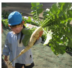
大根の収穫（年長組）

今日から、3学期が始まりました。3学期は、入学や進級に向けて生活を見直し、まとめの大事な時期です。日数は短い3学期ではありますが、子供たちの成長につなげていけるように毎日の生活を大切にしていきたいと思えます。2学期末にお楽しみ会でサンタクロースから「かるた」や「すごろく」をもらいました。また、こま回しを楽しめるように家庭にこまを持ち帰りました。「こままわしをがんばっています」と書かれたうれしい年賀状も届きました。昔遊びと言われるものは、素朴な遊びですが、子供にとっては夢中になれるものが多いです。園でも遊び方を確かめながら、友達と一緒に遊び、教え合ったり、競い合ったりじっくりと遊んでいきたいと思えます。充実した3学期となりますようにご協力をお願いいたします。