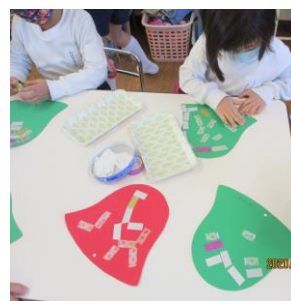
クリスマス製作（年少組）