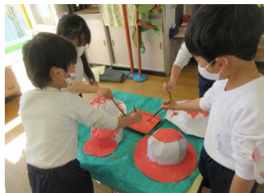
ひな祭り製作（年少組）