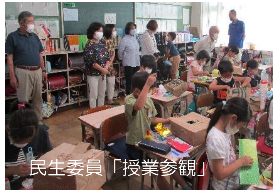
民生委員「授業参観」

さらに11日(土)には、おやじの会の方々に昨年度に続きプール掃除をしていただき、16日(木)には、今年度1回目のPTA 資源回収が、29日(水)には、学校応援団の「読み聞かせ」が約3年ぶりに復活しました。学校応援団のボランティア活動には、「図書整理」6名、「読み聞かせ」6名、「清掃」4名、「園芸」7名、「掲示」5名の延べ28名の申し込みがありました。多くの方々のお力添えをいただいているお陰で、東っ子の笑顔が増えていることを嬉しく思います。