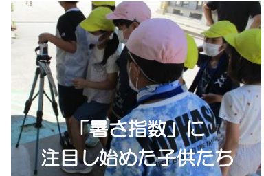
「暑さ指数」に注目し始めた子供たち

子供たちは、コロナ禍の2年半、マスク着用の学校生活を強いられ、今では、外すことに不安を感じることも承知しています。しかし、この異常な暑さにおいては、マスクをし続けることにより、熱中症で体を壊すことのほうを大変心配しています。長い長い暑い夏になりそうです。「命が一番！健康第一！」を意識していきましょう。