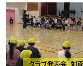
クラブ発表会 対面やビデオで 「来年度、何クラブにしようかな？」