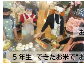
お米作り体験に感謝！