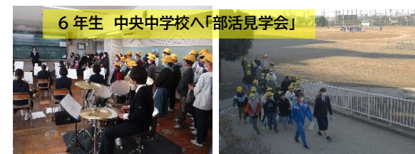
6年生 中央中学校へ「部活見学会」