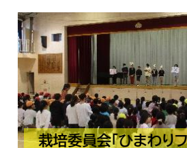
栽培委員会「ひまわりフェス」