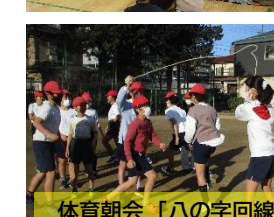
体育朝会 「ハの字回線跳び」 クラスで励まし合って！