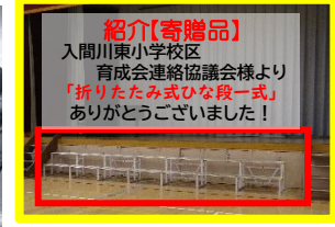
紹介(寄贈品) 入間川東小学校区 育成会連絡協議会様より 「折りたたみ式ひな段一式」 ありがとうございました！