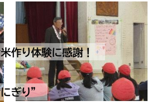
5年生 できたお米で“おにぎり”