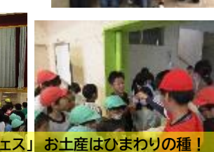
お土産はひまわりの種！