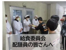
給食委員会 配膳員の皆さんへ