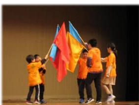
12/1くすの学級学習発表会