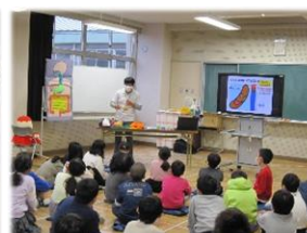
12/7おなか元気教室 (3年)