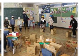
12/10堀っ子なかよし広場