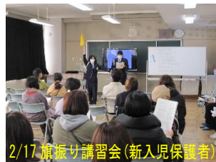
2/17 旗振り講習会(新入児保護者)