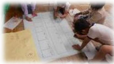
ひばり 学校の地図づくり