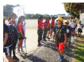
柏原中学校との合同あいさつ運動

地域の方から、「子供たちのあいさつが素晴らしい」というお話を聞きました。登下校の時、道で会った時、「おはようございます」「こんにちは」と元気に言う子がたくさんいるのだそうです。子供たちにあいさつをされると元気をもらえる気がするそうです。集会所の中でも、外から子供たちの声が聞こえると、明るい気持ちになるとおっしゃっていました。