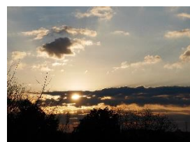
柏原小屋上からの初日の出

皆様には、令和8年の新春を健やかにお迎えのこととお慶び申し上げます。本年もよろしくお願い申し上げます。新しい年を迎え、子どもたちの笑顔とともに学校生活が始まりました。今年は干支でいうと「午（うま）」の年です。馬は古くから、人々の暮らしを支え、遠くまで駆け抜ける力強さを象徴してきました。そのため「健康」や「豊作」を示すだけでなく、「物事がうまくいく」「幸運が駆け込んでくる」という意味合いからよいことが起こりやすく、日々の努力が実り、結果として報われる年とも言われています。