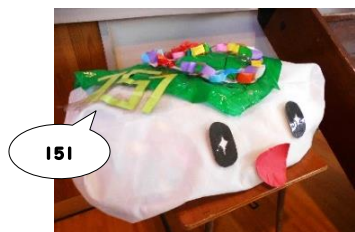
子供たち手作りの「かしわもっちょ」