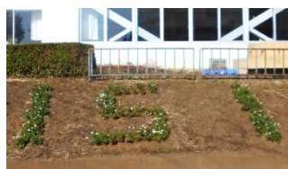
柏原小学校は1月14日に151回目の開校記念日を迎えます