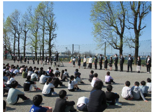
青空のもと 新学期スタート。 始業式