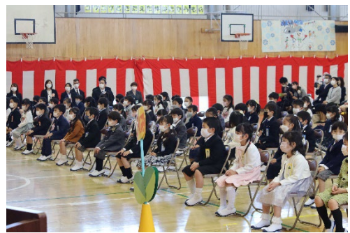
ようこそ南小へ。 入学式