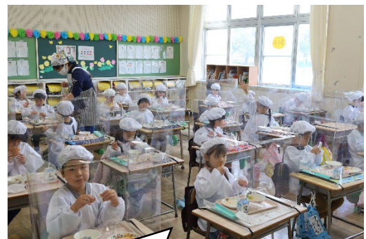
一年生 初めての給食!