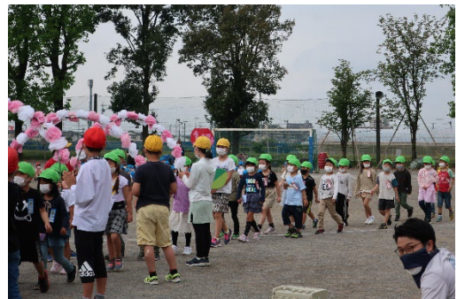
花のアーチをくぐって 一年生を迎える会