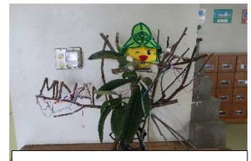
運動会バージョン!