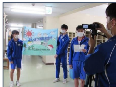
ZOOM を使用しての生徒朝会の様子(9月14日)