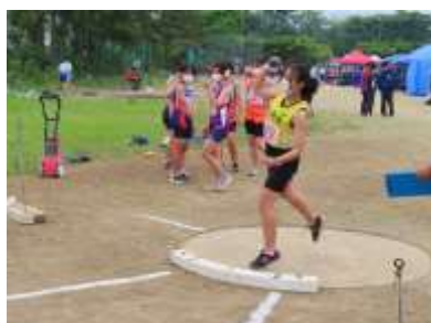
通信陸上大会 女子砲丸投げ の様子

令和4年度通信陸上大会市予選会 <1年生女子100m> 優勝(県大会へ) <男子3000m> 優勝(県大会へ)