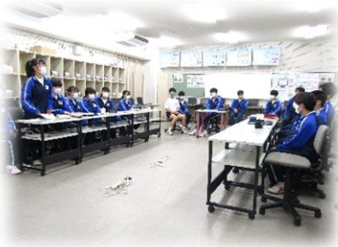
対話的な学びの授業風景