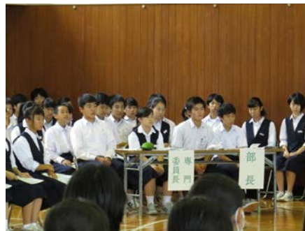
各専門委員長と各部長