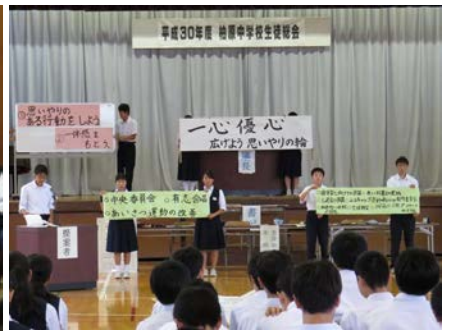
方針を提案する生徒会本部