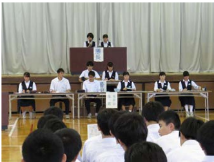
生徒会本部と議長団