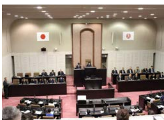
事務局(左)とご来賓