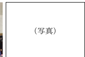
柏原中の生徒会本部役員