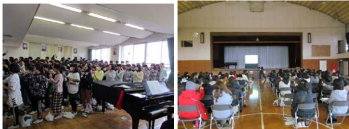
<写真・左：校歌練習の準備運動をする児童たち、右：講義を聴く新入生保護者の皆さん>

来年度入学する児童（現時点で92名）が体験入学のため、2月8日（金）の午後に本校に来校しました。どの児童も、しっかりとした挨拶を交わし、全員揃ってした挨拶は、大きな声でとても立派な挨拶でした。音楽室で、柏原中の校歌の練習をしたり、3年生の生徒が作成した柏原中を紹介するスライドを見たりしながら、中学校について学びました。体験入学と同時に、新入生の保護者の方々にもおいでいただき、保護者説明会を実施しました。入学にあたっての多くの説明の後、本校の元校長をされた〇〇〇〇教諭（現在）による、子育てやスマホ・携帯の危険性等についての、講義を聞いていただきました。