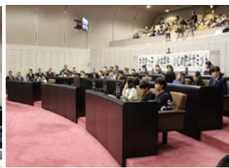
各小中学校の代表