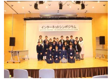
他校の代表者と記念撮影

青少年を育てる狭山市民会議主催の、斉2回インターネット・シンポジウムが、狭山市民交流センターで開催され、本校から、2年生の〇〇〇〇くん、1年生の〇〇〇〇さんが出席し、積極的に意見を述べたり、発表したりと、活躍してくれました。内容は、インターネットの危険性について考えるもので、全国的に話題になっている「香川県ネット・ゲーム依存症対策条例(仮称)」や「自撮り被害」についてグループ協議をしました。また、インターネットの使い方について、来場者と参会者と中学生との意見交換の場もありました。