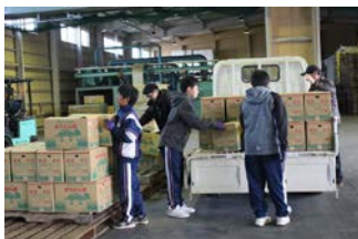
JAいるま野販売センター

進路指導・キャリア教育の一環として、1年生が職場体験(3Daysチャレンジ)を行いました。狭山市内と近隣の30の事業所(写真下の□内)のご協力で、実りある体験活動ができました。生徒たちは、働く苦勞を身をもって体験するとともに、仕事をとおして人や社会のために役立つことの尊さを学びました。すべての職場を回らせていただき、それぞれの職場で、真剣に仕事に励んでいる姿に、頼もしさを感じました。体験活動後は、活動の感想、成果や反省なども含め、それぞれの職場にお礼状を書きました。この体験を、これからの学校生活や将来の自己実現に、ぜひ活かせるよう願っています。