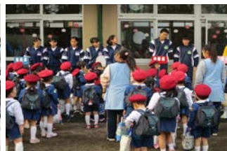
けやき認定こども園