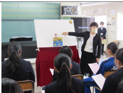
12/3 高校出前授業（2年生） 近隣の8校の高校の先生にご来校いただき、ミニ説明会・体験授業・質問会見を通して進路に対する意識を高めることができました。