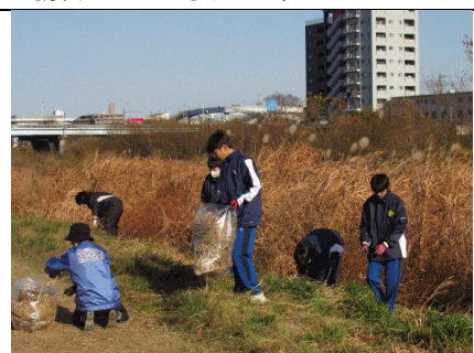
12/13 入間川清掃ボランティア 約40名の生徒が入間川河川敷の清掃に取り組みました。主催者の「入間川の岸辺を美しくする会左岸」の方からは、毎年西中生に大いに支えられていると感謝されました。