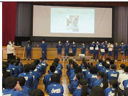
12/2 いのちの授業（3年生） NPO法人さやま保育サポートの会の皆さんにご来校いただき妊婦体験や育児体験、ご講演をいただきました。