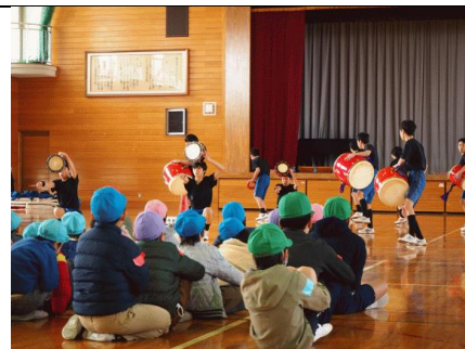
12/11 特別支援学級小中交流会 おおぞら学級と校区内小学校の特別支援学級の児童生徒が日頃の活動を発表しあったり一緒にレクを楽しみました。