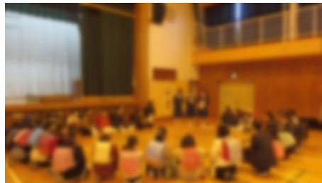
クラスごとに集めて説明する生徒会役員

来年度入学してくる山王小・御狩場小の6年生が、午後から来校して約2時間という限られた時間でしたが、中学校の様子を自分の目で確かめてもらいました。当日は生徒会本部の生徒がオリエンテーションを企画してくれたり、部活動見学の案内役を務めてくれたりしました。また、各部も日頃の練習を見せてくれたり趣向を凝らした取組もあり小学生にとってよい機会になったと思います。1・2年生の皆さんありがとうございました。