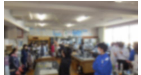
科学者が不思議な現象を披露し驚く小学生