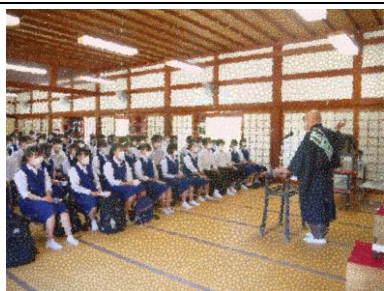
薬師寺での講話 面白くためになる話を聞きました。「今何をするべきなのか」熱いメッセージを忘れずに。