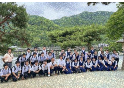
渡月橋（2組）最終日は北野天満宮と嵐山方面の見学でした。予報は雨でしたが、何とか降られずに済みました。