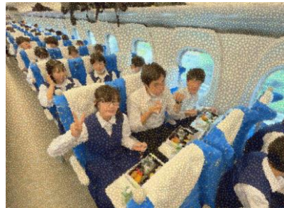
新幹線で朝食 感染防止のためにお菓子なし、座席移動なしでしたが、楽しいひと時を過ごしました。