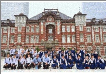
初日の東京駅（1組）早く着いたので駅舎を背景に記念撮影。ここでクラス写真を撮ったのは初めてのこと！