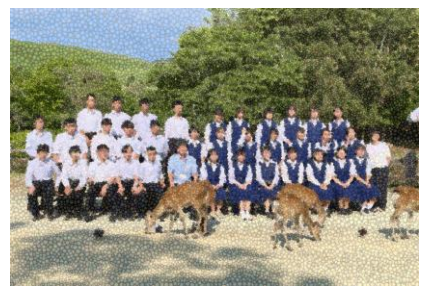
東大寺（3組）熱中症が心配になるくらいの暑さでした。奈良公園界限を班ごとに見学した後の記念撮影です。