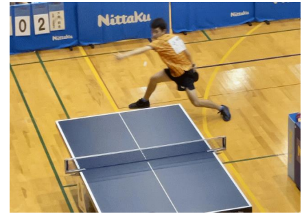
8/24 高知県で行われた全国大会での様子