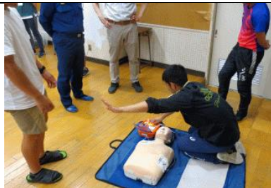
6/12 職員の救急救命講習。毎年行っている訓練です。狭山消防署水野分署の皆さんありがとうございました。