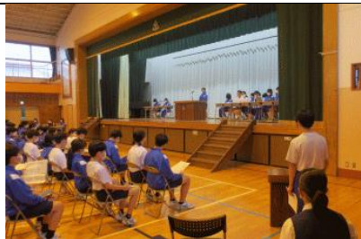
6/2 4年ぶりに対面で開かれた生徒総会。今年度の生徒会活動の方針等について全校生徒で確認しました。