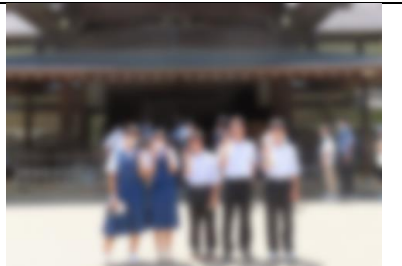
6/16 2年生校外学習。小江戸川越の名所を班ごとにルートを決めて回りました。写真は本丸御殿の様子です。