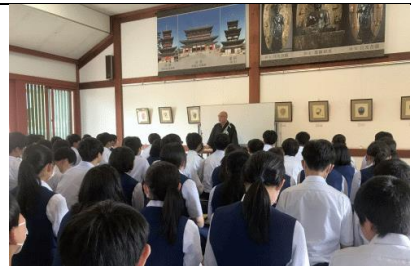
6/14～16 3年生修学旅行。初日の奈良薬師寺での法話の様子です。面白くてためになるお話を聞くことができました。