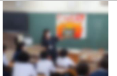
6/22 読み聞かせ朝会 図書ボランティアさんに来校していただき、読み聞かせ朝会を実施しました。

8・9月の行事予定はスクリーンで配信いたします。細かい文字が見つからない場合は、学校だより2号で紹介した方法をご覧ください。