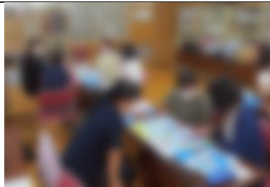
6/21 家庭教育学級。SDGsについてのアクティビティを行いました。ご参加いただいた皆さんありがとうございました。