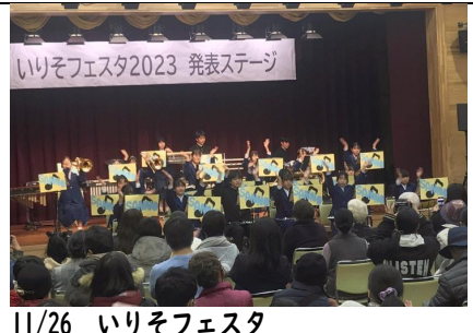
11/26 いりそフェスタ 地域交流センターで、最後の出し物として吹奏楽部が演奏しました。超満員です。