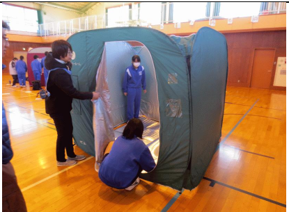
11/19 狭山市総合防災訓練 15名の生徒が参加し、簡易トイレやパーティションなどの設営訓練をしました。