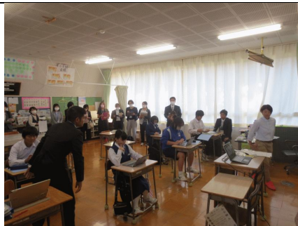
11/9 市教研一斉研究会研究授業 やまびこ学級の生徒の皆さんが、頑張って取り組みました。