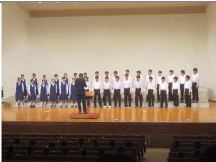
11/7 市内音楽会 1-2、2-1、3-1が参加しました。きれいな合唱をありがとうございました。