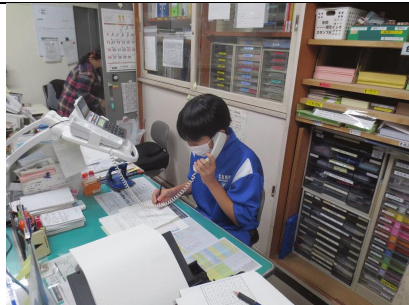
11月某日 1年生職場体験の予約電話 ドキドキしながら、受け入れ先事業所へ電話をかける。これも社会勉強です。