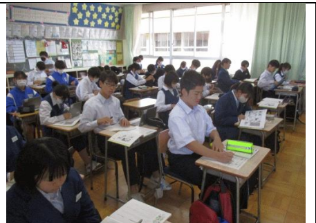
11/11 学校公開(一斉道徳授業) 久しぶりの公開土曜日ですが、いつも通りの素晴らしい授業態度です。姿勢が完璧。