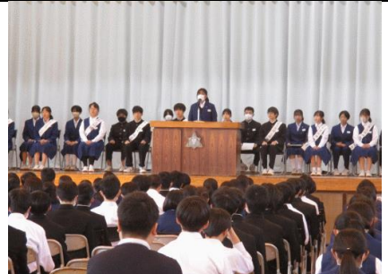
11/17 立会演説会 生徒会役員改選のための演説会が行われました。応援者も含めみな立派な演説でした。