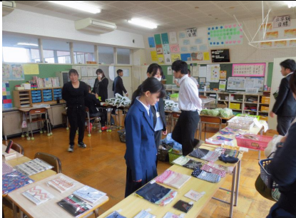
11/11 やまびこ学級販売会 手作り作品や野菜、マドレーヌを販売しました。職員室でも大好評でした。