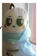
お世話になりました