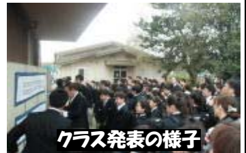
クラス発表の様子

一つ目、「勉強に対して、前向きに取り組む」ということ。 中学校の勉強は教科毎に担当する先生が代わることは知っていますね。内容も小学校に比べて専門的になります。少し難しくもなります。それでも勉強は、自分の将来のために必要な学びです。得意な分野や不得意な分野があるでしょう。しかし、得意だから、好きだから一生懸命やる、不得意だから、苦手だからあまり積極的にやらないというのは、よくありません。何事も最初からうまくいくことばかりではありません。初めは難しく感じても、あまり上手にできなくても、少し我慢をしてやってみる、続けてみる。直ぐに諦めたり、面倒がらずに、とにかくやってみる。「継続は力なり」です。そうしていくうちに、「わかった、できた」という喜びの気持ちが生まれてきます。それを積み重ねていくことで、少しずつ自分に「自信」が持てるようになっていきます。中学校での勉強は、新たな発見が沢山あります。ですから一つ目の期待は、「勉強に対して前向きに取り組んでほしい」ということです。