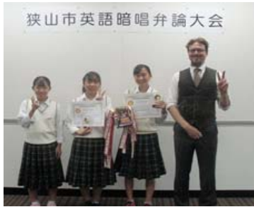
狭山市英語暗唱弁論大会