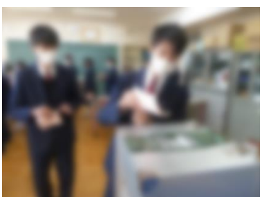
【本物の投票箱にいざ投票！】