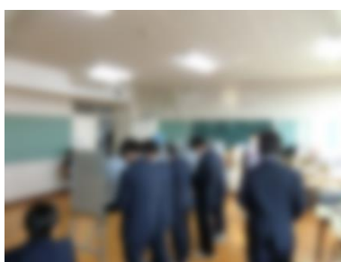
【本物の記載台に向かって…】