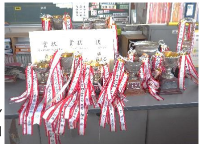
【多くの優勝カップと賞状】