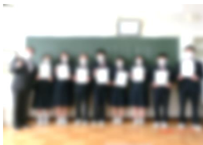
【新本部・任命書を手笑顔！】