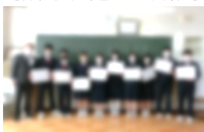
【旧本部・感謝状を手笑顔！】