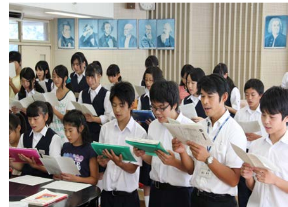
【オープンスクール中央】