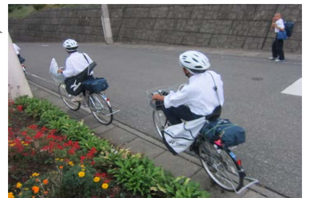
【ヘルメットでの自転車通学】